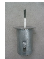
verriegelbar mit Entriegler