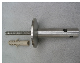
Wandhalter mit Gewindebolzen