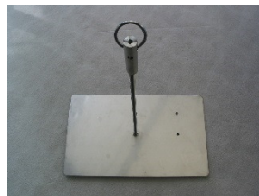
Bodenanker z.B. für Pflanztrog