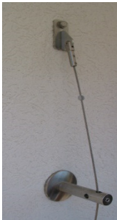
Schrägabspannung zur Zugentlastung