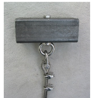
Befestigung an Träger