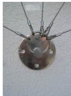
mit Ring für sternförmige Seilführung